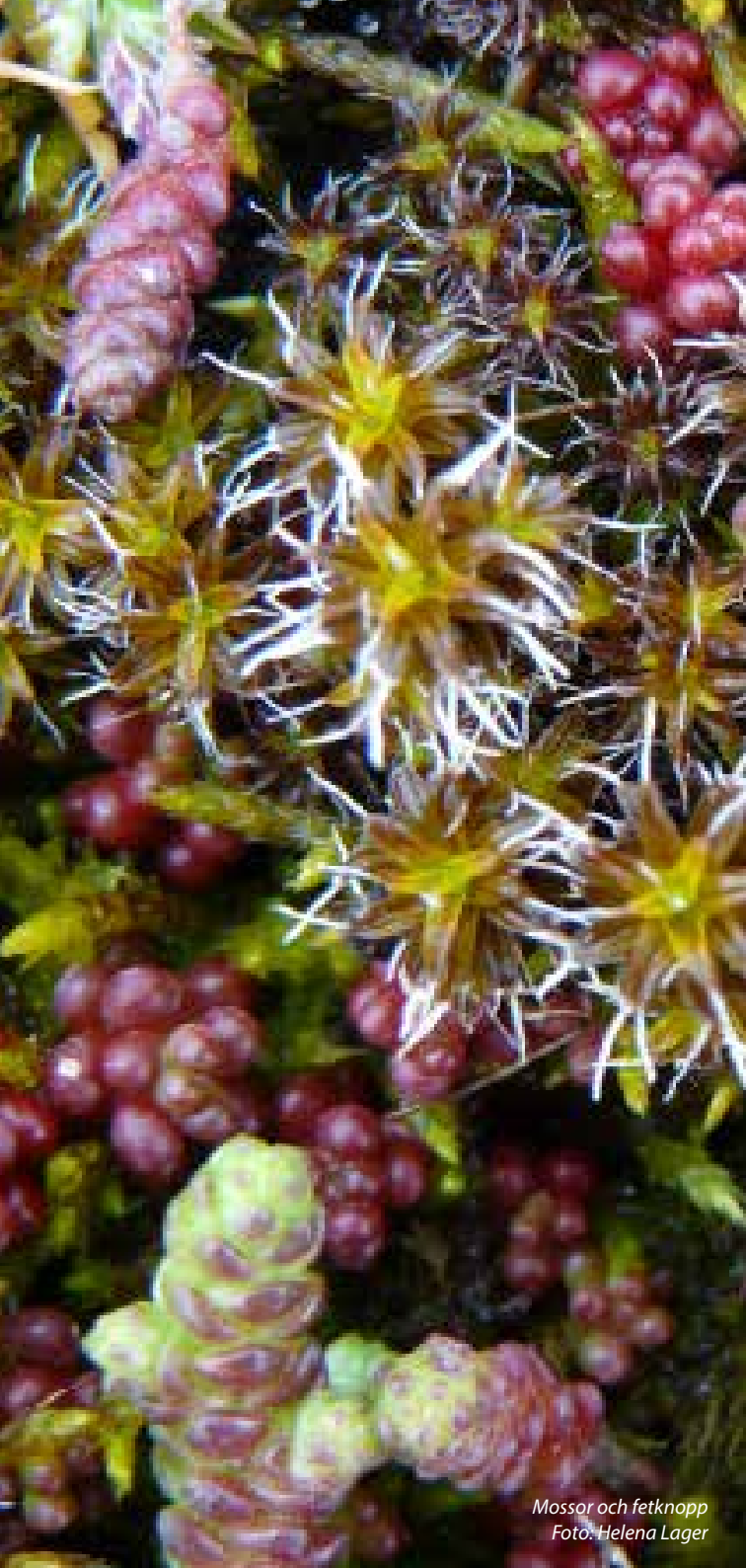
Mossor och fetknopp