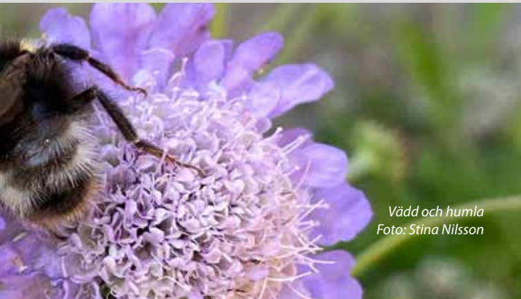
Vädd och humla