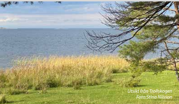
Utsikt från Trollskogen