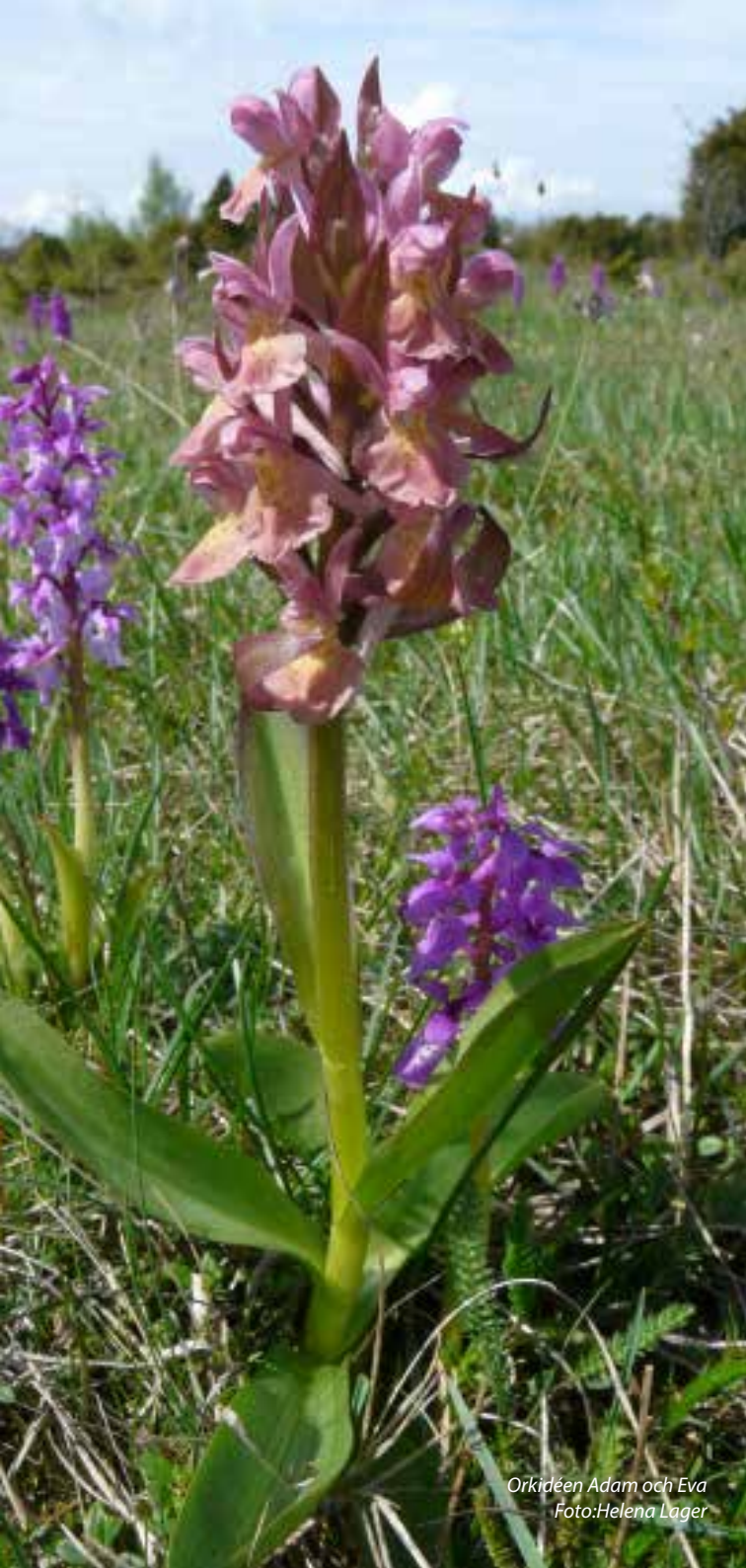
Orkidéen Adam och Eva