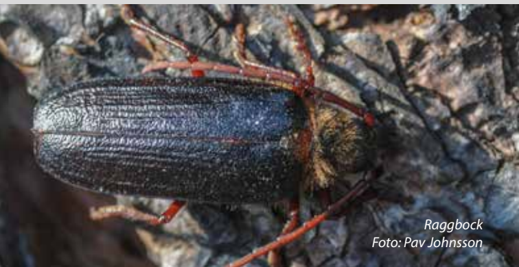
Raggbock