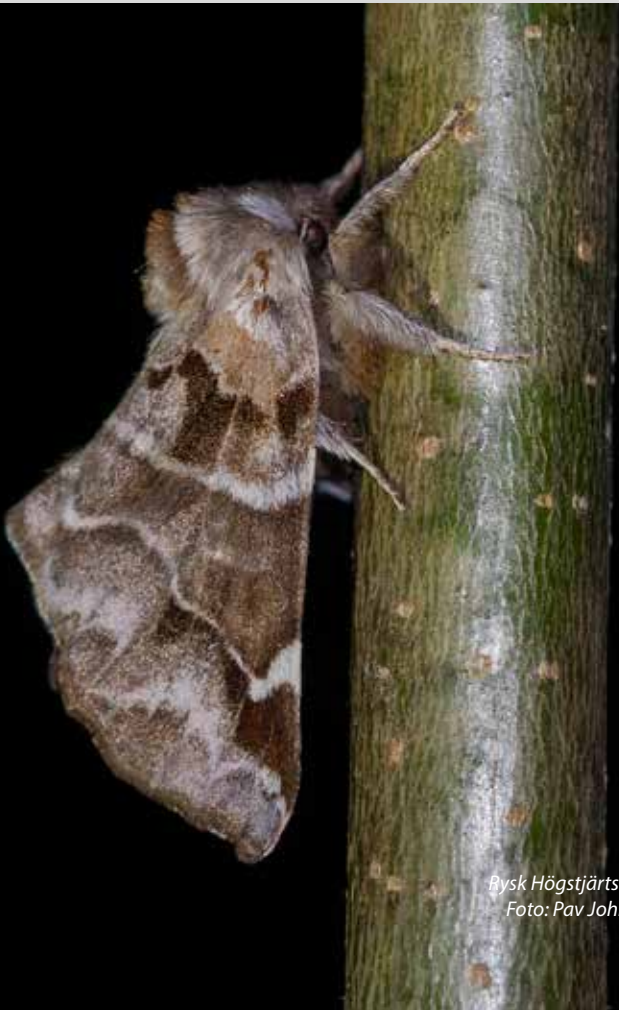
Bysk Högstjärts hona