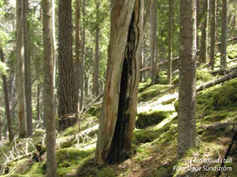
Brandljud i tall

"Det ärtidig morgon. Ett sömnigt disskymtar mellan trädstammarna när jag börjar min vandring genom skogen. Allt är stilla. Tystnaden är slående, en lyx som nutidsmänniskan har svårt att hitta. Här finns den. Men tystnaden är bara en mänsklig tystnad. Medens hör jag brus från bäckkravinen, trädens som kvidandelutar sig mot varandra, hackspettens målmedvetna mejslande i någon torr furu, en tillrande silverstrof från en vaken rödhake."