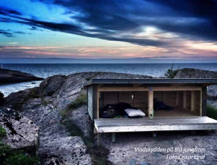
Vindskydden på Blå jungfrun

”Efter den sista mödosamma stigningen upp mot toppen så sitter jag här. Jag smeker med handen över några skrovliga ristningar i stenen bredvid mig. Det är en hälsning från en av alla de som arbetade med stenbrytningen här ute i början av förra seklet. En havsörn cirklar högt över mitt huvud. Blå jungfrun är en magisk plats, på alla vis”.