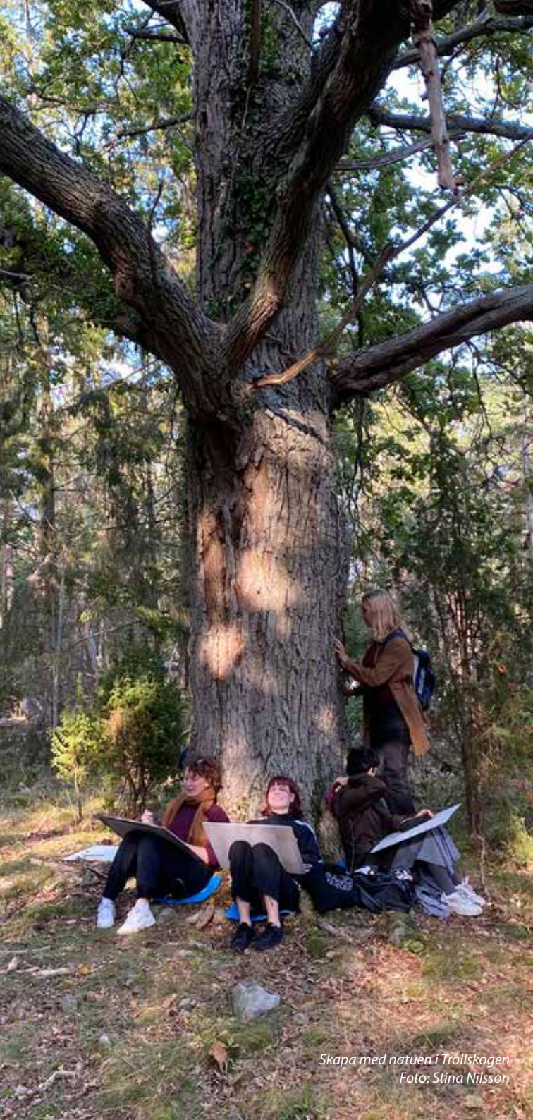
Skapa med natuen i Tröllskogen